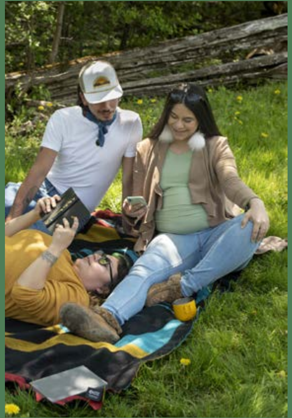
3 Photos cira.ca

participation autochtone au sein de sa direction, avec une représentation autochtone au conseil d'administration et des communautés des Premières Nations en tant qu'investisseurs. À ce titre, il considère la réconciliation comme une valeur organisationnelle et cherche à « être un partenaire respectueux dans la réconciliation économique, en collaborant avec des partenaires autochtones locaux et régionaux » [trad]. Alors que le CBP fait preuve d'un engagement exceptionnel, d'autres organismes ont collaboré de diverses manières avec des partenaires autochtones en travaillant avec des conférenciers, des consultants ou des professionnels du tourisme autochtones.